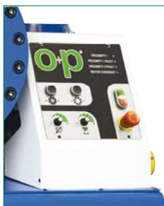
◀ ELEKTRO-MECHANICZNY UKŁAD KONTROLI STEROWANIA