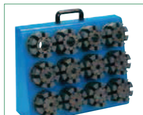
▲ TABLICA DO MAGAZYNOWANIA SZCZEK